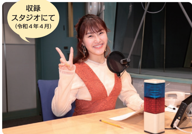
収録 スタジオにて (令和4年4月)