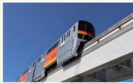
市内を走る多摩モノレール

今回はそんな新選組のゆかりの地を巡りながら、京王線高幡不動駅からJR中央線日野駅までを散策してみました。