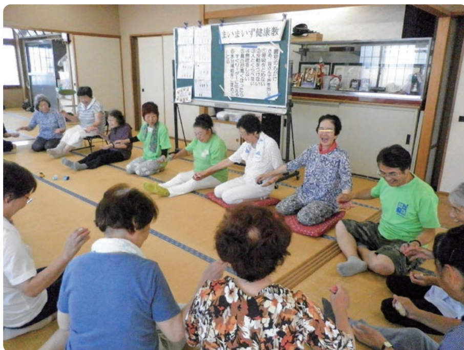
「まいまいず健康教室」での様子

介護予防リーダー自身も、新しい情報を敏感にキャッチし、常にチャレンジしながら、参加者とともに元気になっていくという、専門の講師が一方向的に指導する教室では得られない効果をもたらしています。